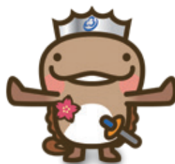
邑南町:オオナン・ショウ