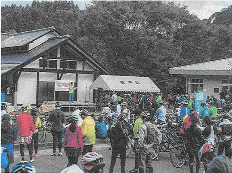
● 美郷町 グルメフوند in 美郷 で交流会