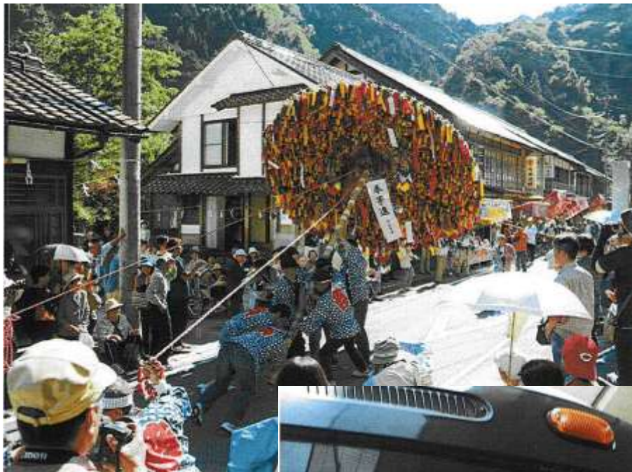
● 邑南町 江の川鉄道応援団